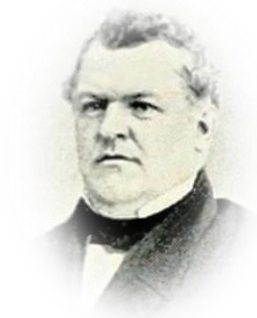
Häradshövding Pehr Staaf i Hudiksvall