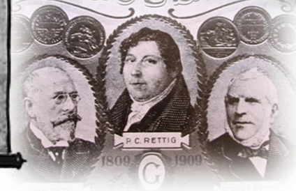
Familjen Rettig - tobaksfabrikörer, rederiägare, kulturengagerade